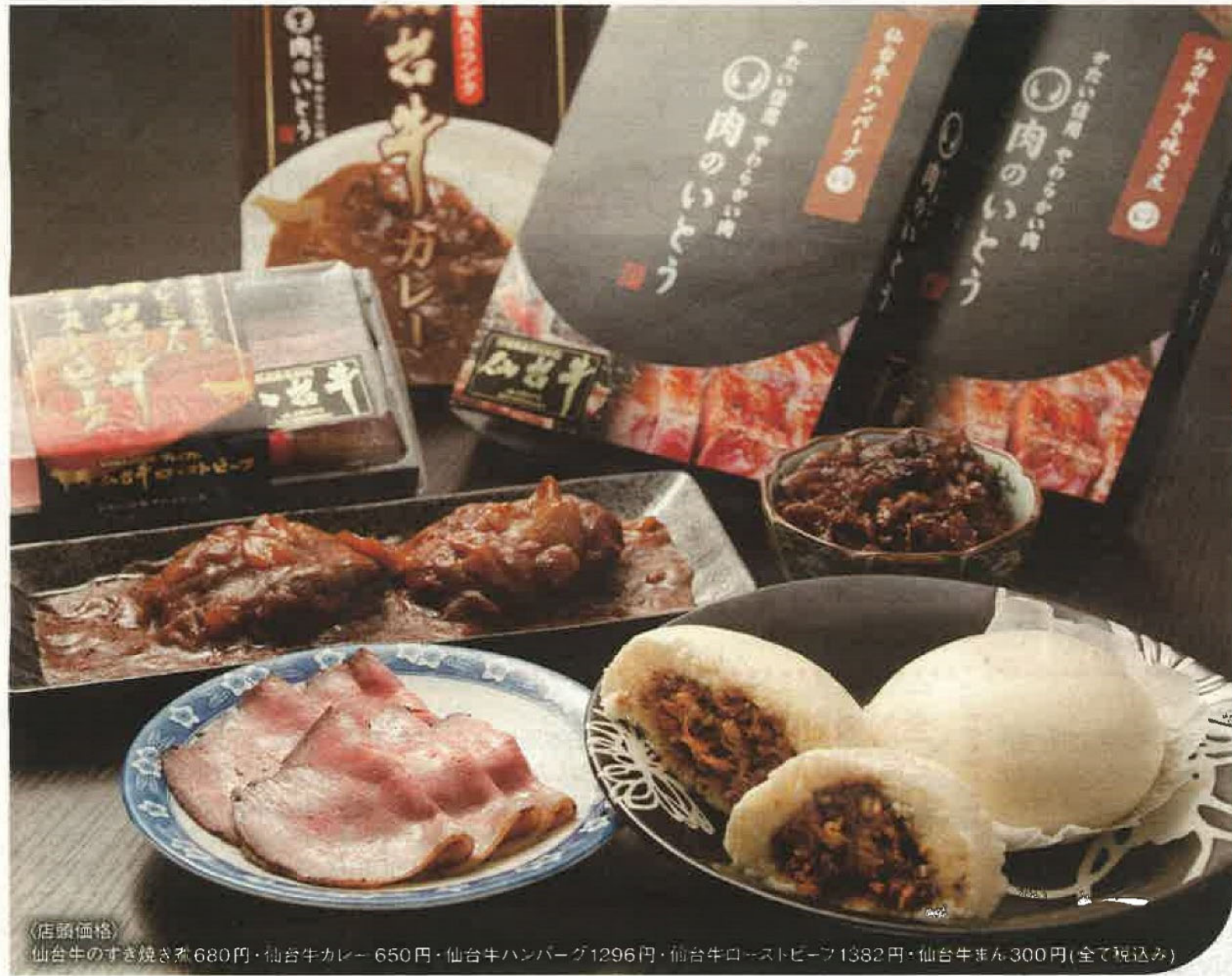
〈店頭価格〉 仙台牛のすき焼き煮 680円・仙台牛カレー 650円・仙台牛ハンバーグ1296円・仙台牛ローストビーフ1382円・仙台牛まん 300円(全て税込)