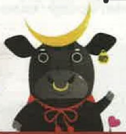
仙台牛PRキャラクター 牛政宗くん